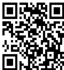
競技結果速報 サービス

* 忘れ物があった場合、プログラム掲載の「大会忘れ物調査のお願い」（FAX 送信票）に必要事項を記入の上、鹿児島県水泳連盟事務局まで FAX にて問い合わせること。