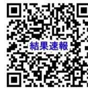
(一社) 鹿児島県水泳連盟 競技結果速報サービス