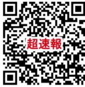
超速報 Web サービス