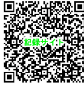
(一社) 鹿児島県水泳連盟 専用記録サイト